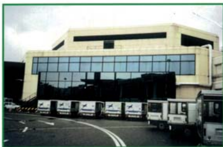
Malpensa 2000 - Milano