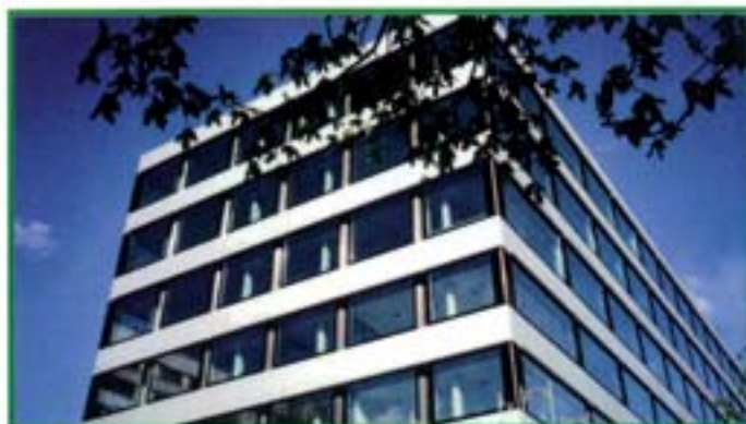
Golden Ring - Mosca