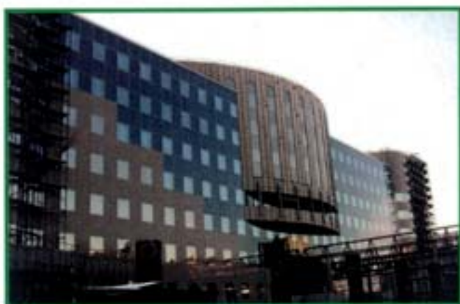
Banca Centrale - Mosca