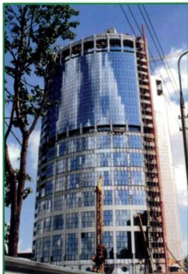
Reforma - Mosca