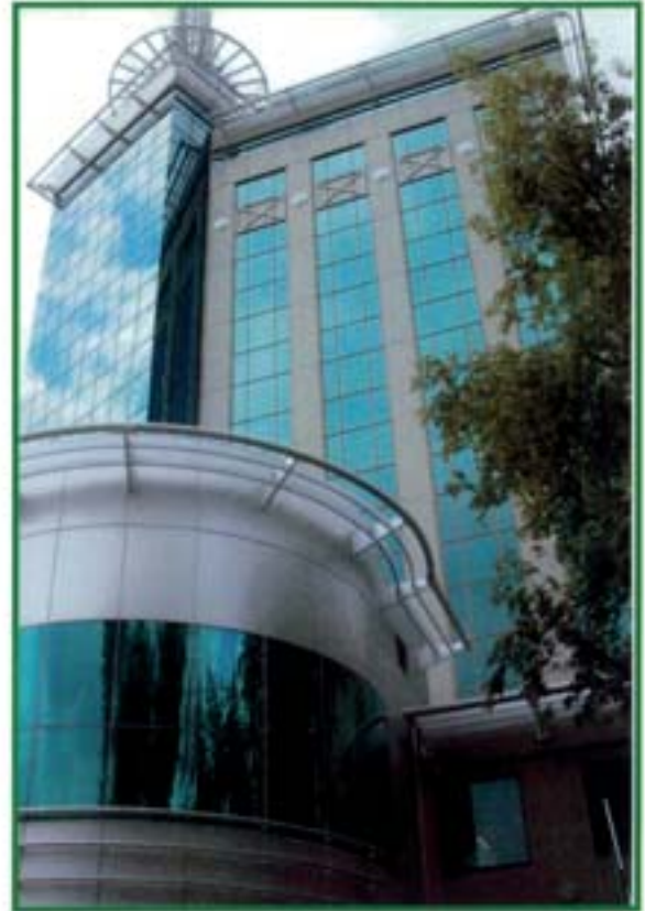
Nikkoil - Russia