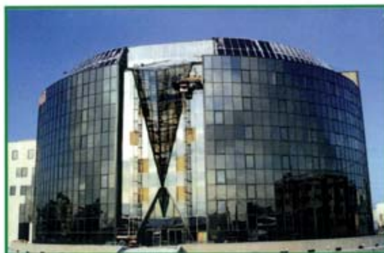
Iakutzia - Siberia