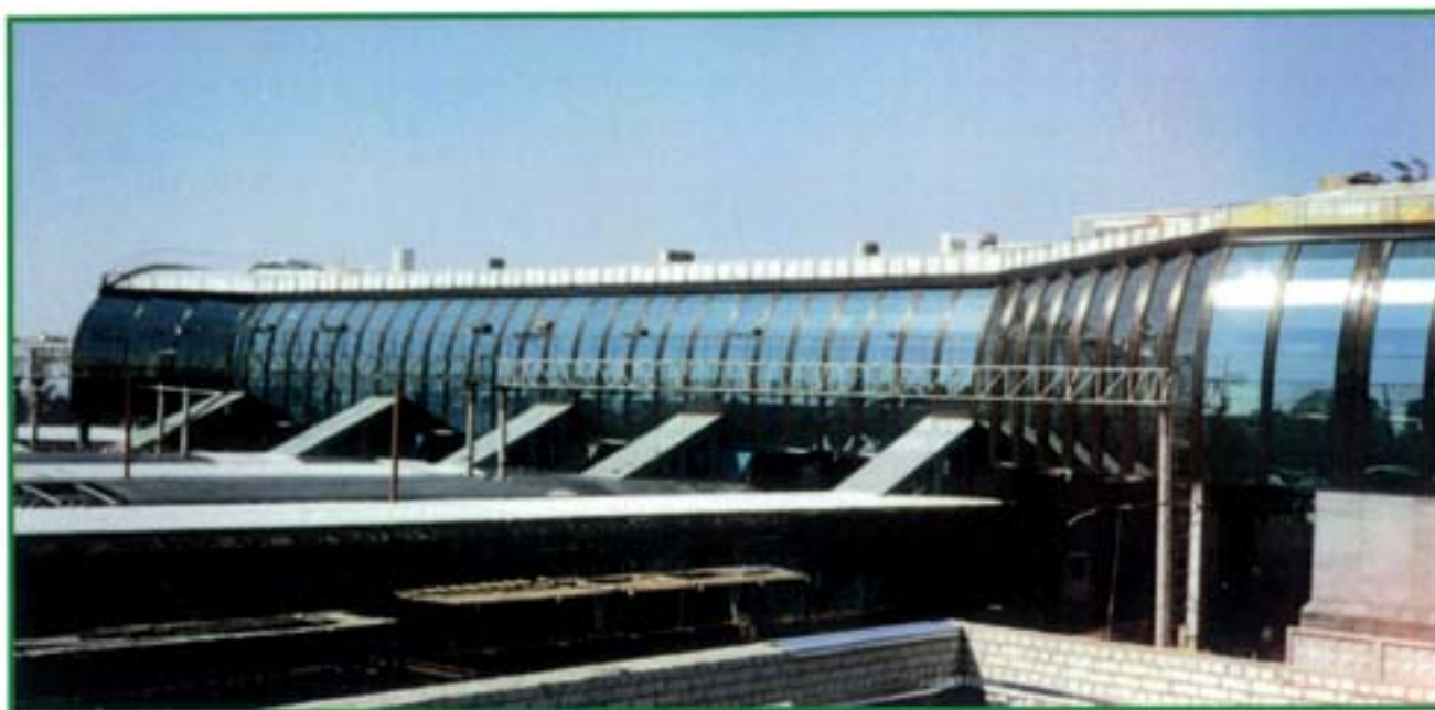
Cupola Tunnel Ferroviario - Samara