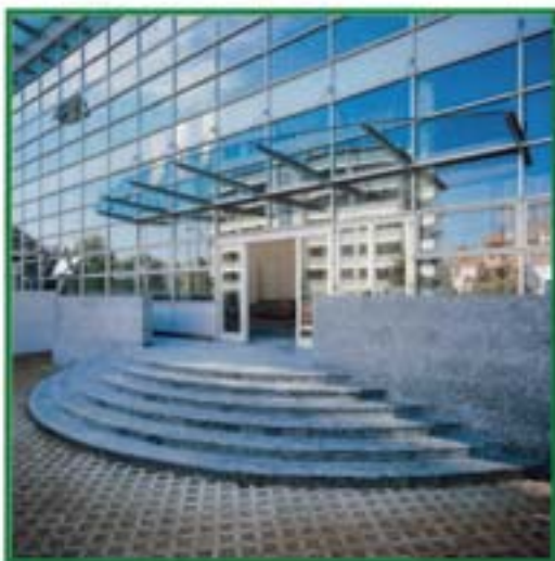
Audi Italia - Sesto San Giovanni (MI)