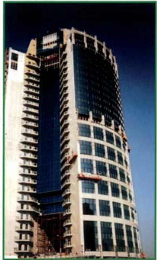
Rubinstein - Telaviv