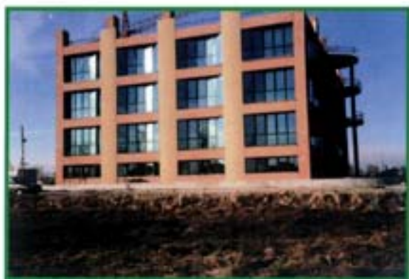
AEM - Cremona