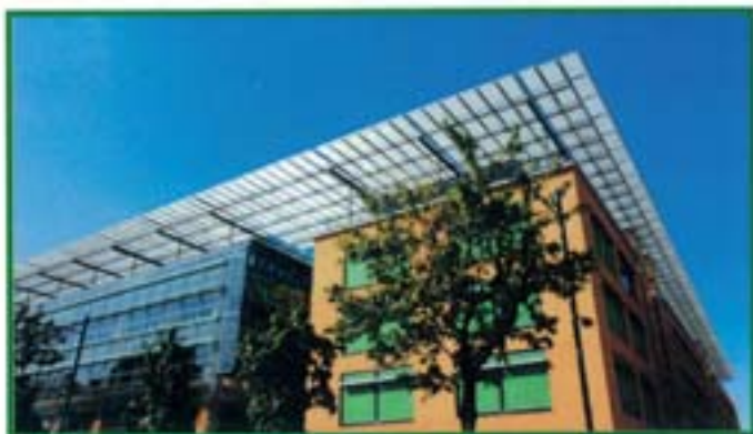
Il Sole 24 Ore - Milano