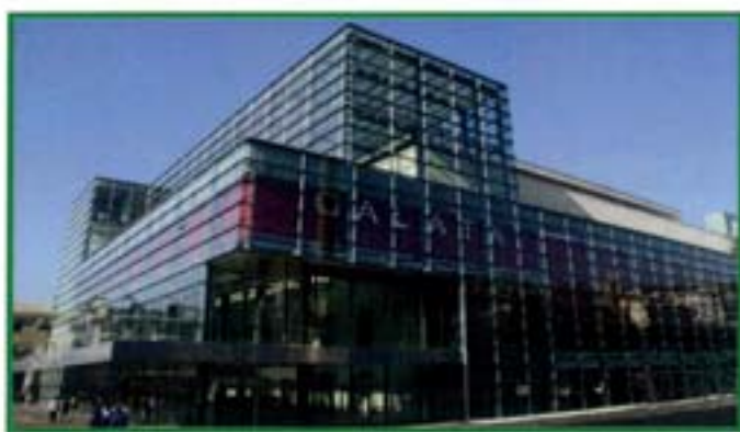
Museo del Mare - Genova