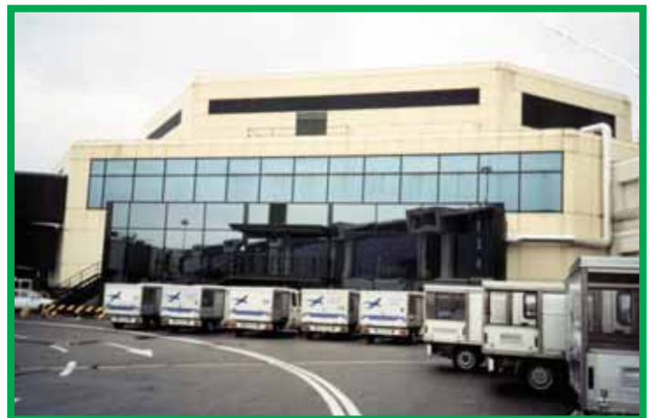
Мальпенза - Милан