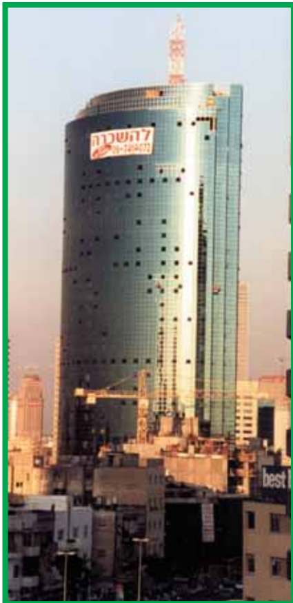
Рубинштейн – Тель Авив