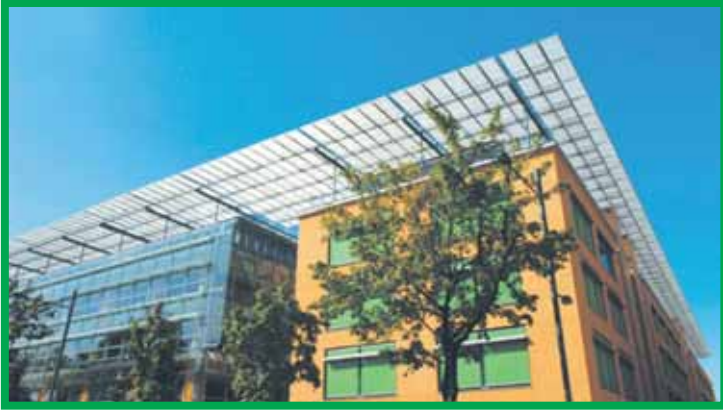
Солнце 24 часа – Милан