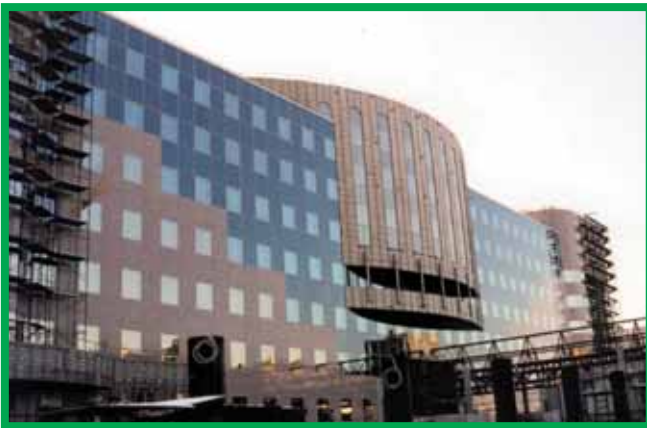
Кредитный Банк – Москва