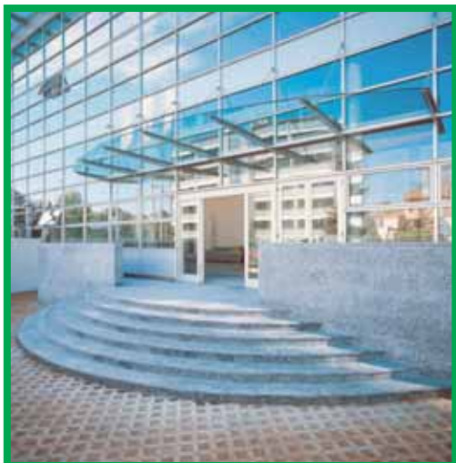
Ауди Италия – Милан