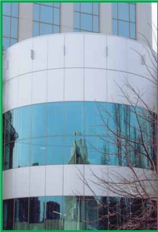
Никкоил – Россия