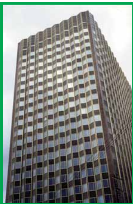
Золотое кольцо – Москва