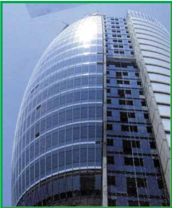
Башня-Парус – Израиль