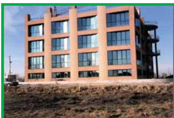
АЕМ – Кремона