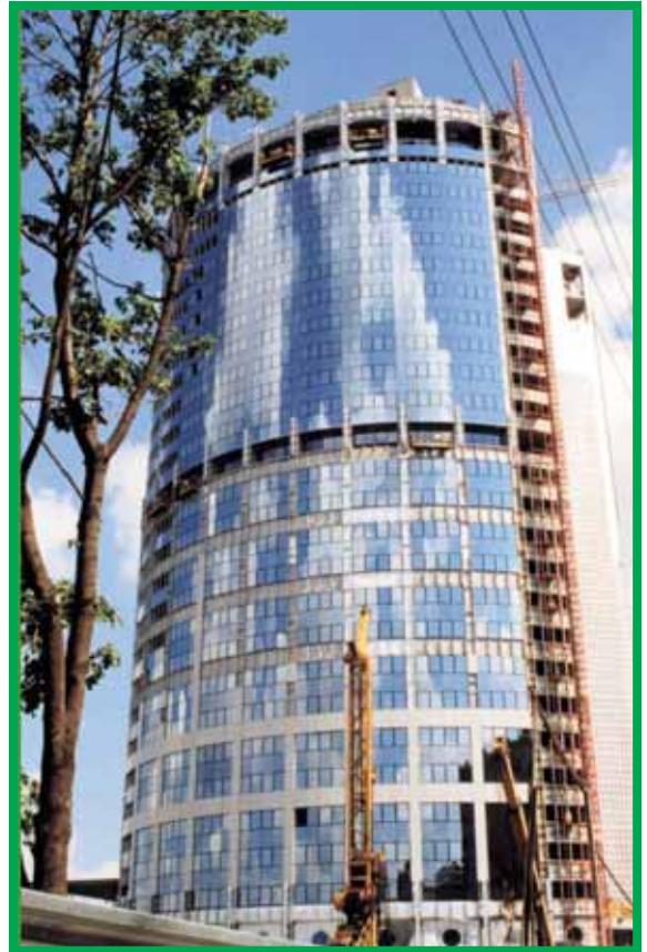
Реформа - Москва