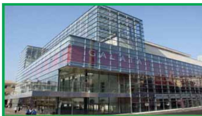
Музей моря – Генуя